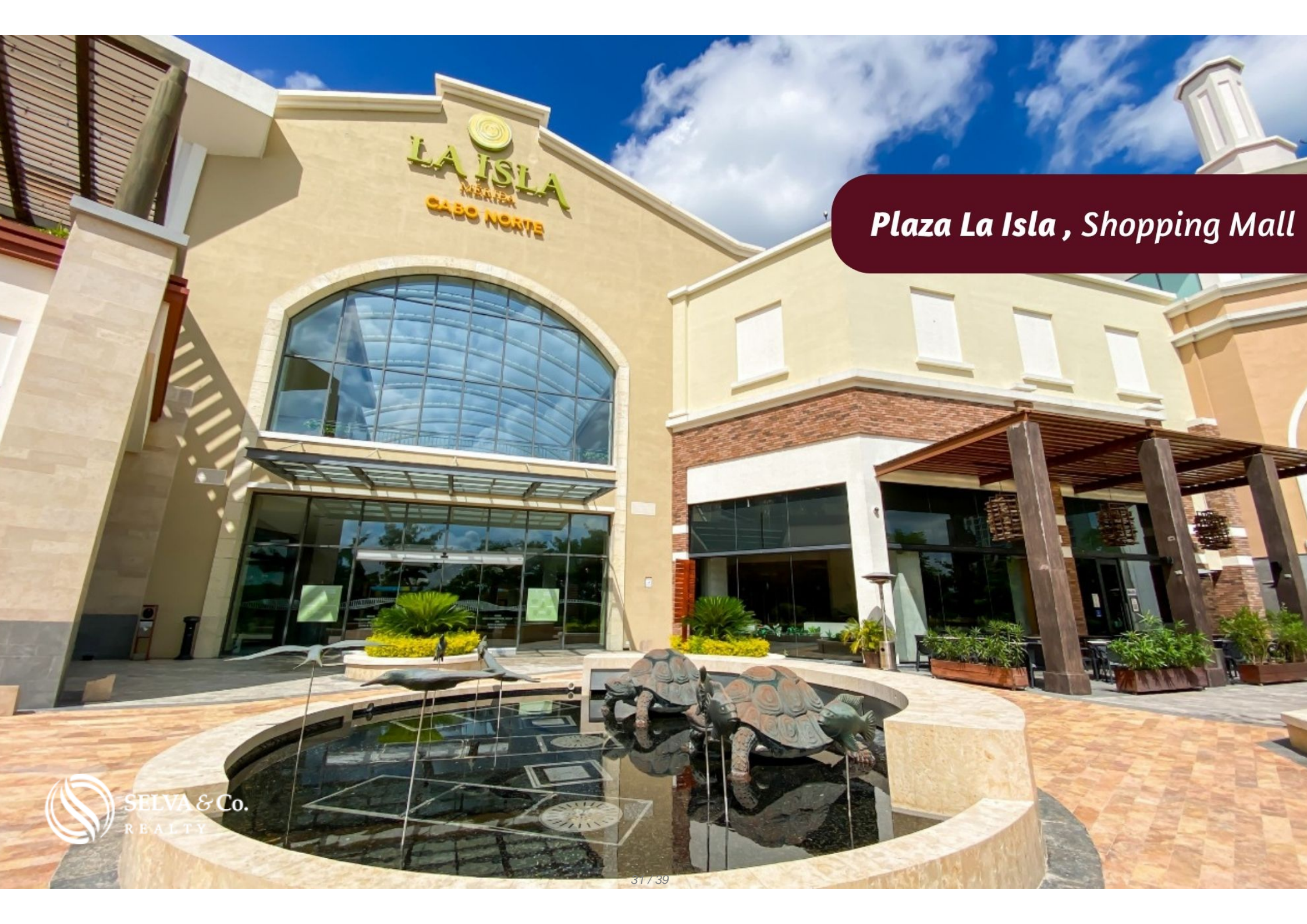
Plaza La Isla , Shopping Mall