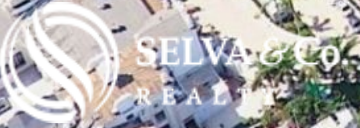
Campo de golf Playacar Playacar golf Course