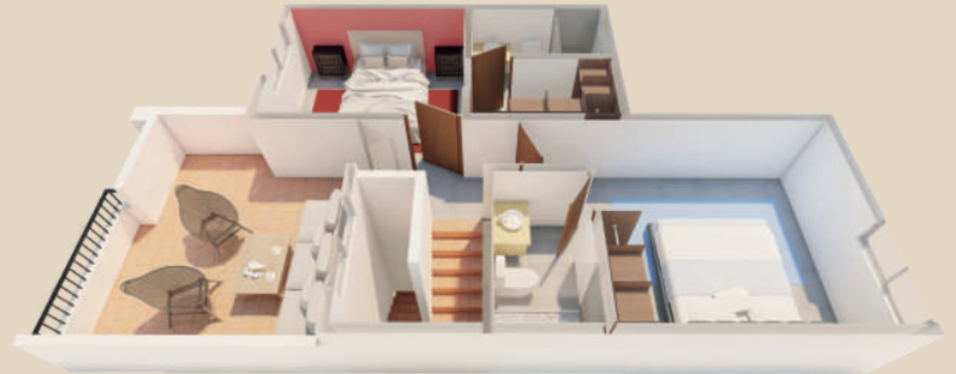
PLANTA ALTA TOP FLOOR