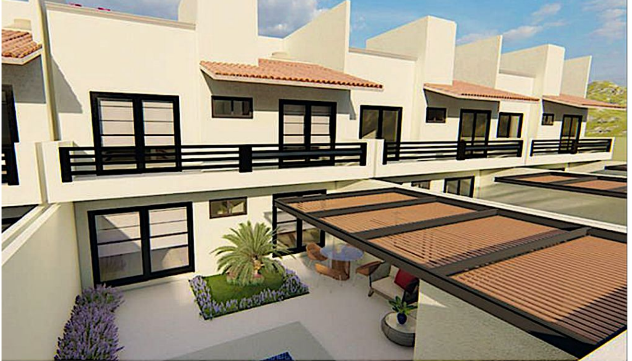
Terraza semi techada Semi roofed terrace