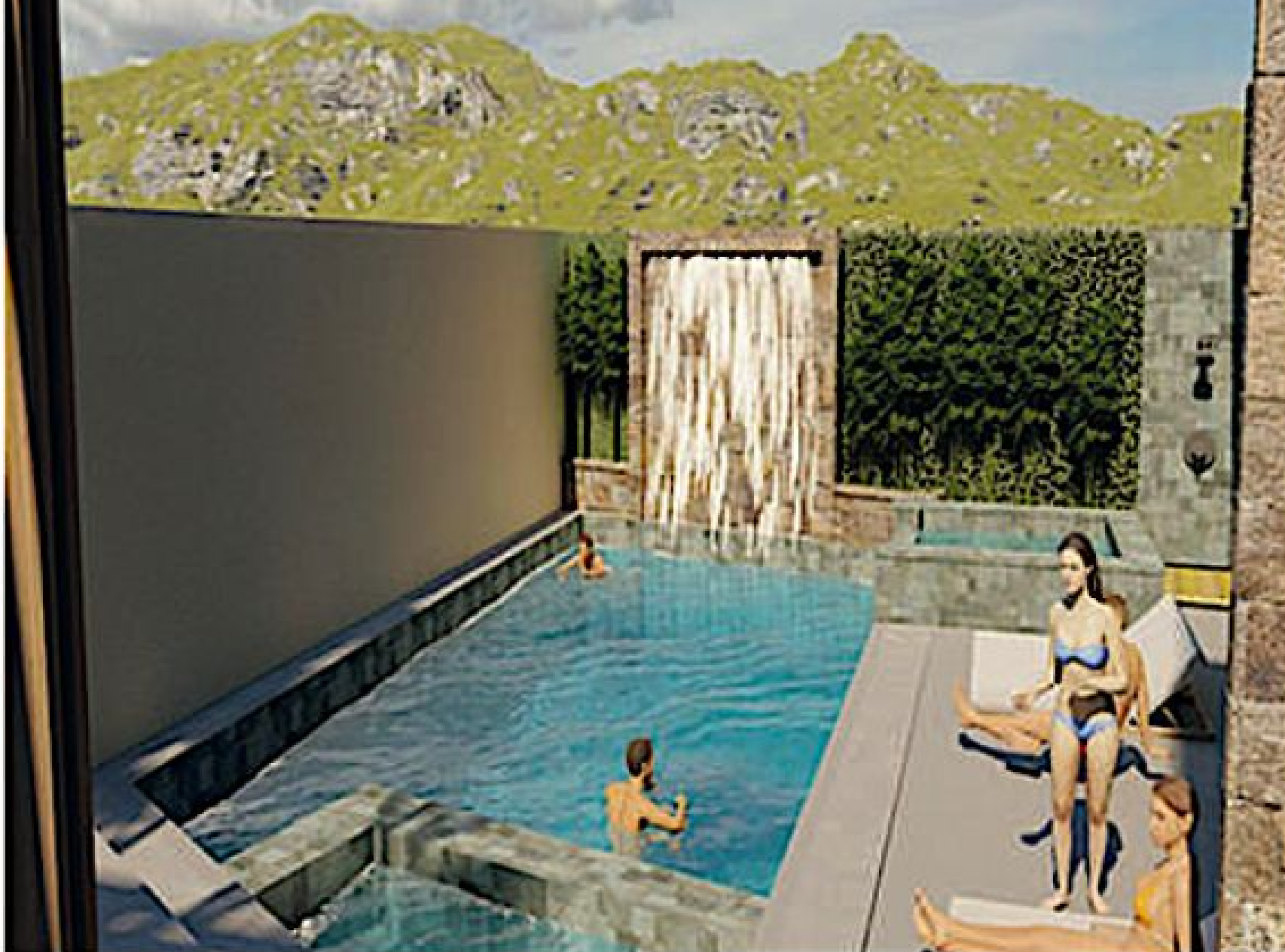
Alberca y jacuzzi Pool & jacuzzi