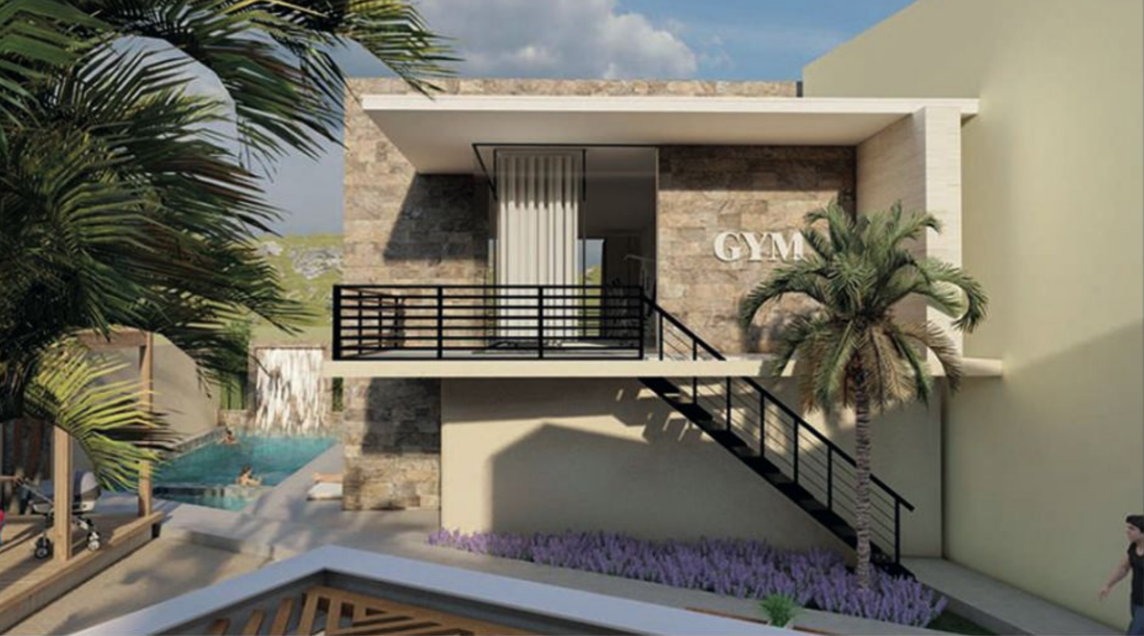
Gimnasio y alberca Pool & Gym