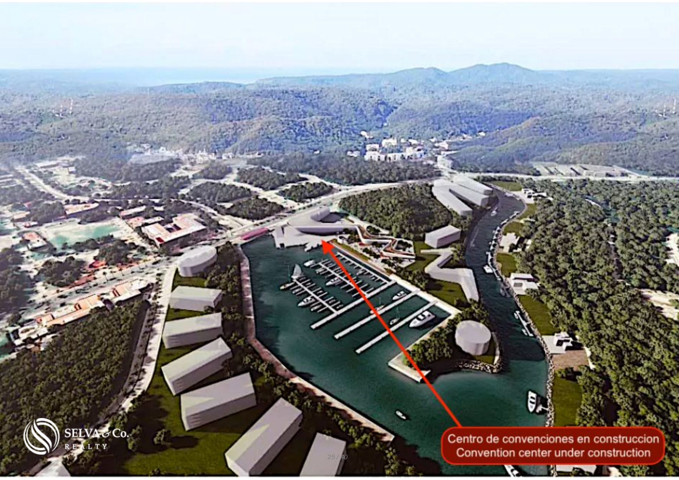
Centro de convenciones en construcción Convention center under construction