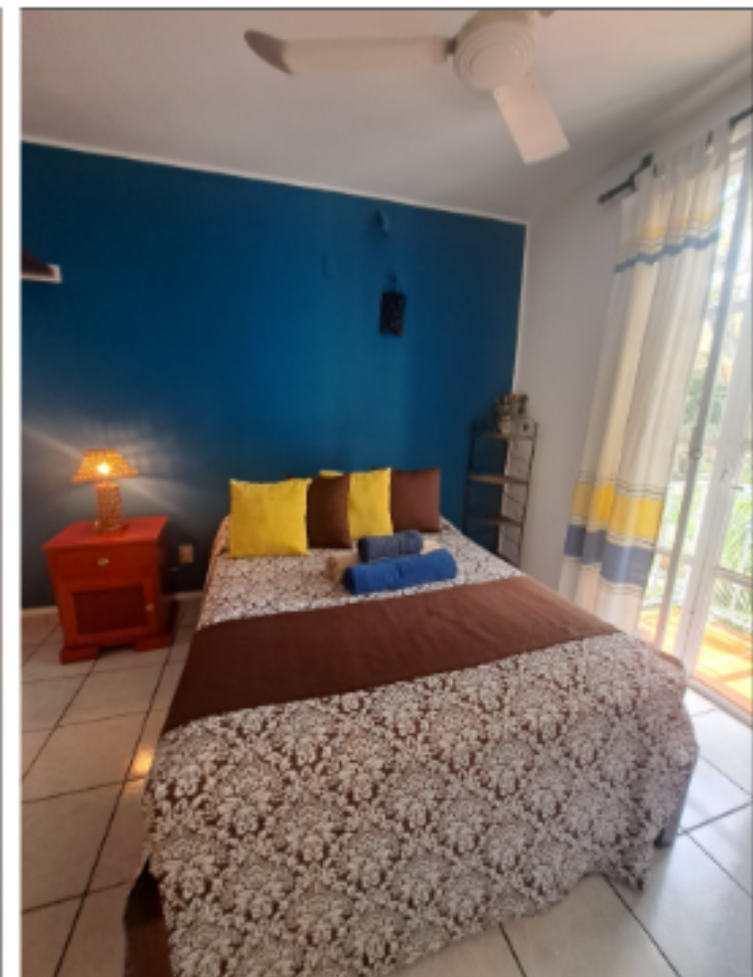
Recamara principal Main bedroom