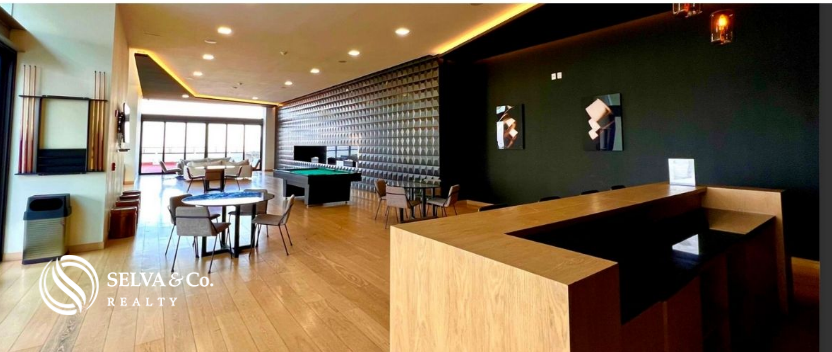
Game room of adults