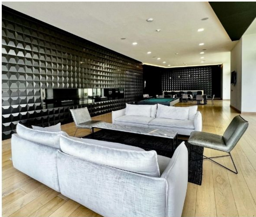
Sala de juegos de adultos