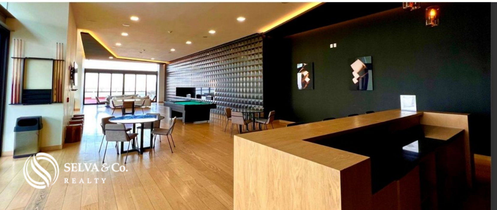
Game room of adults