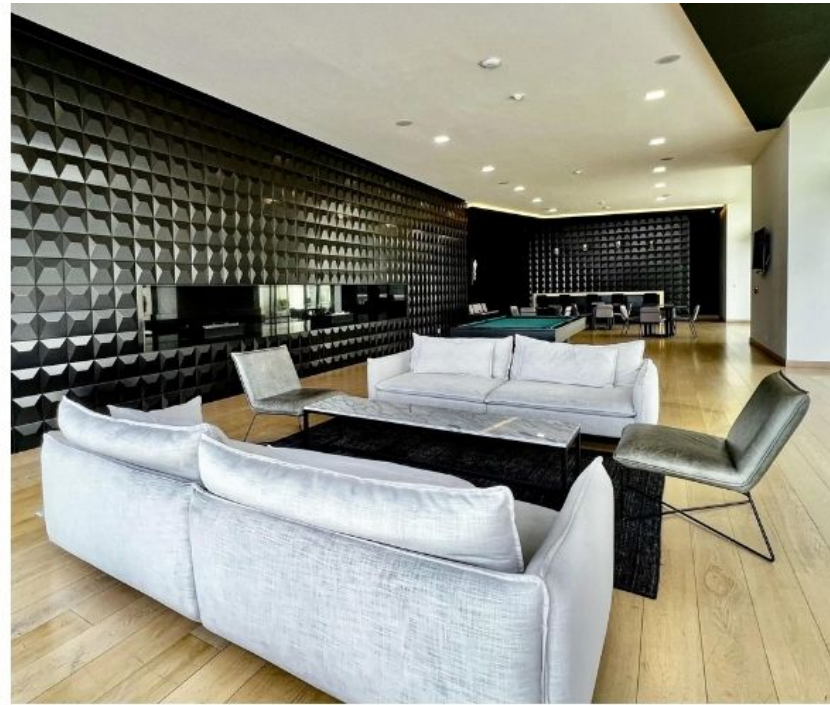
Sala de juegos de adultos