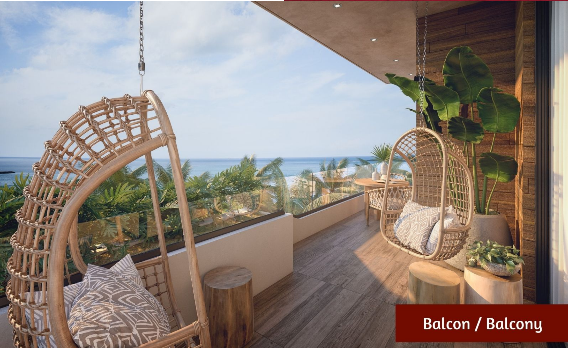
Balcon / Balcony