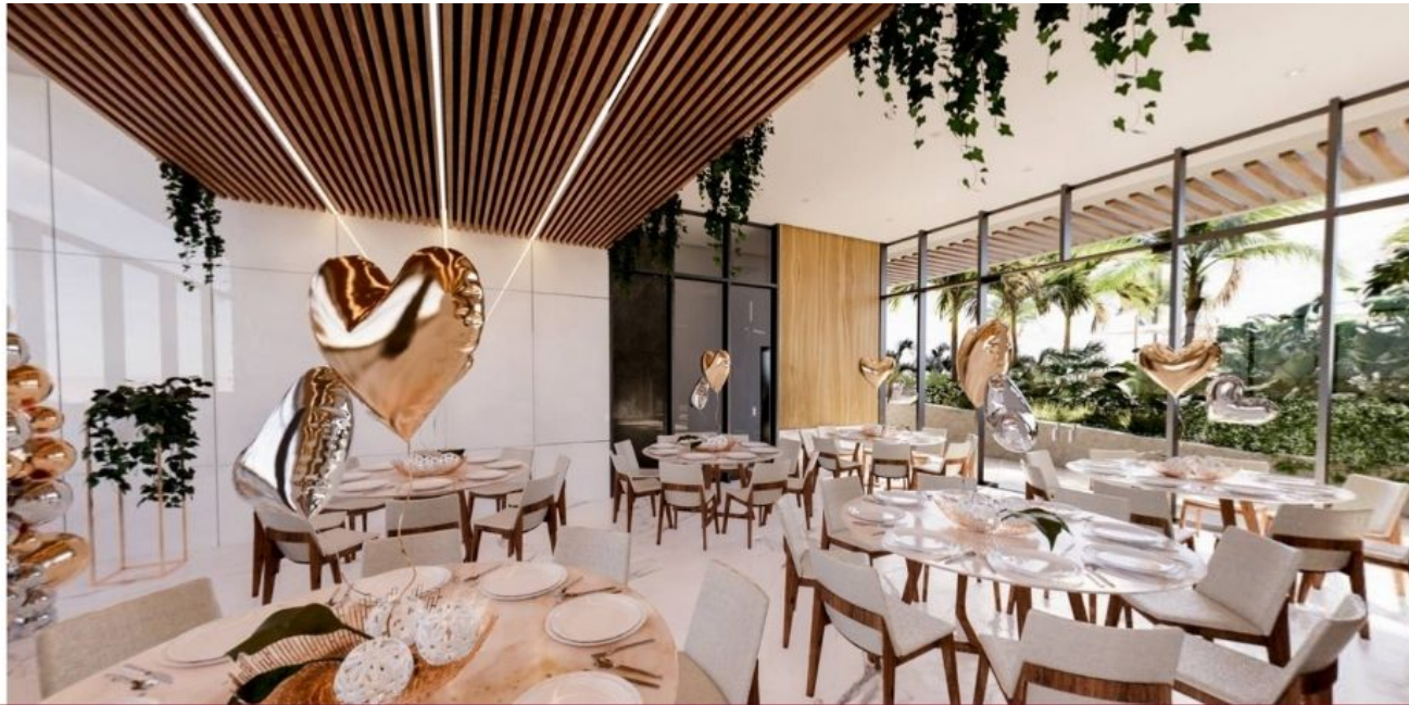
Salon de usos multiples / multipurpose room