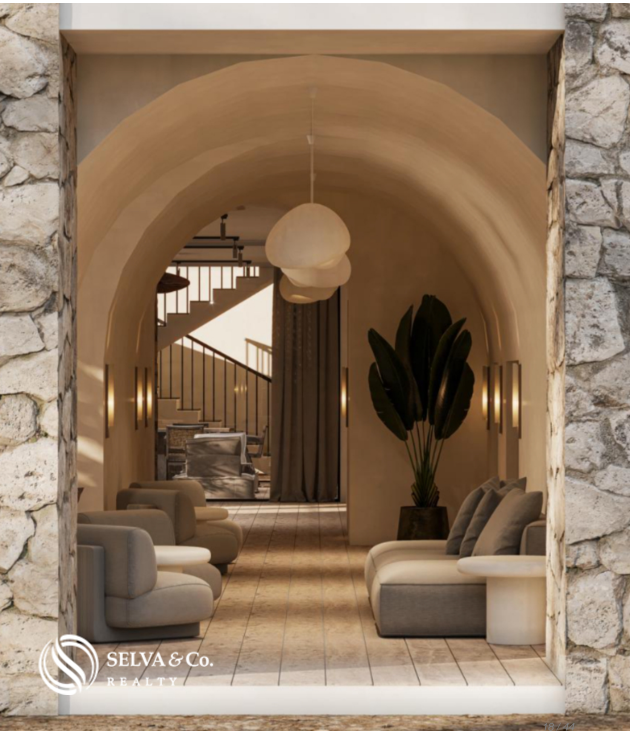
Lobby de acceso Access lobby