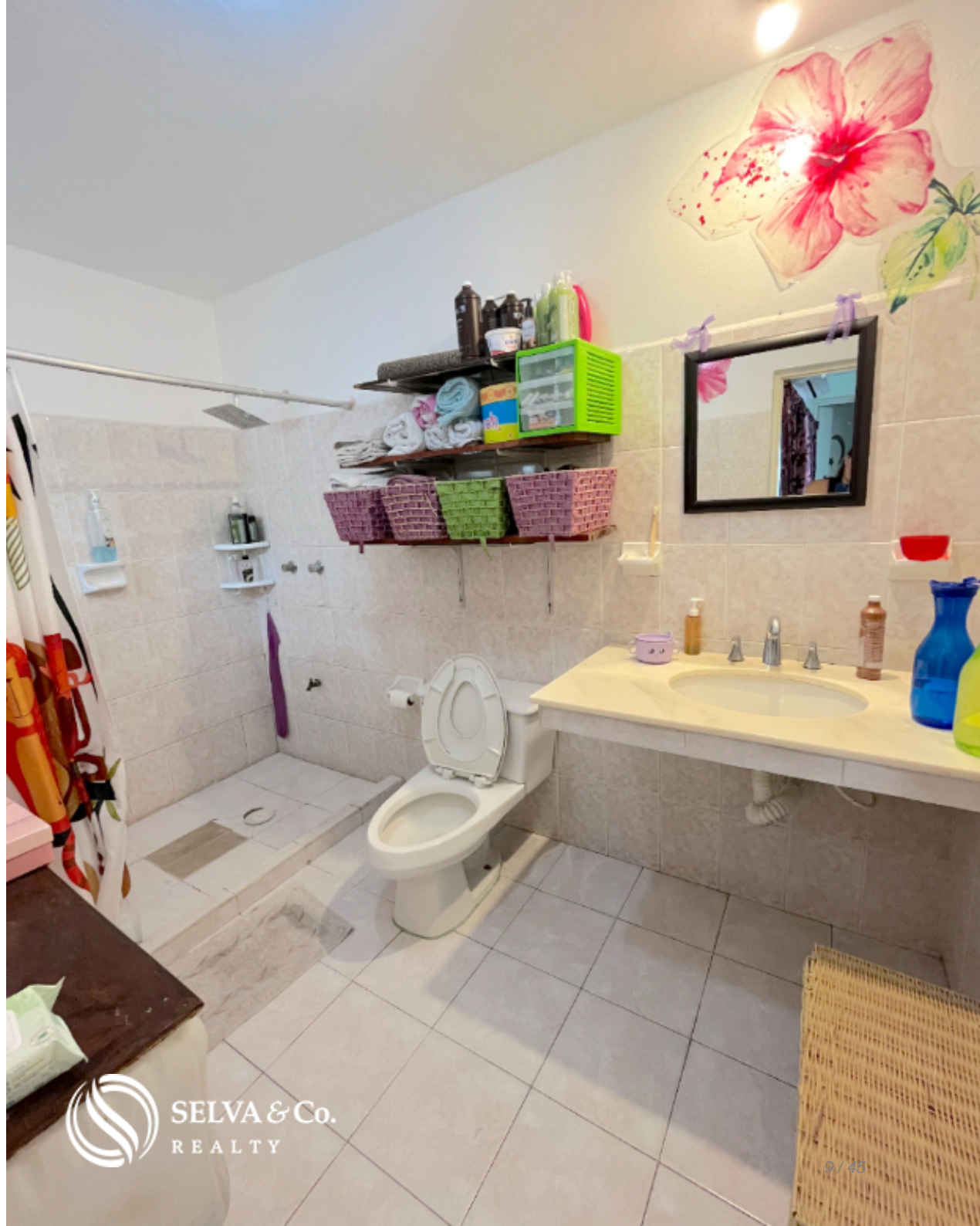
Baño amplio Wide Bathroom