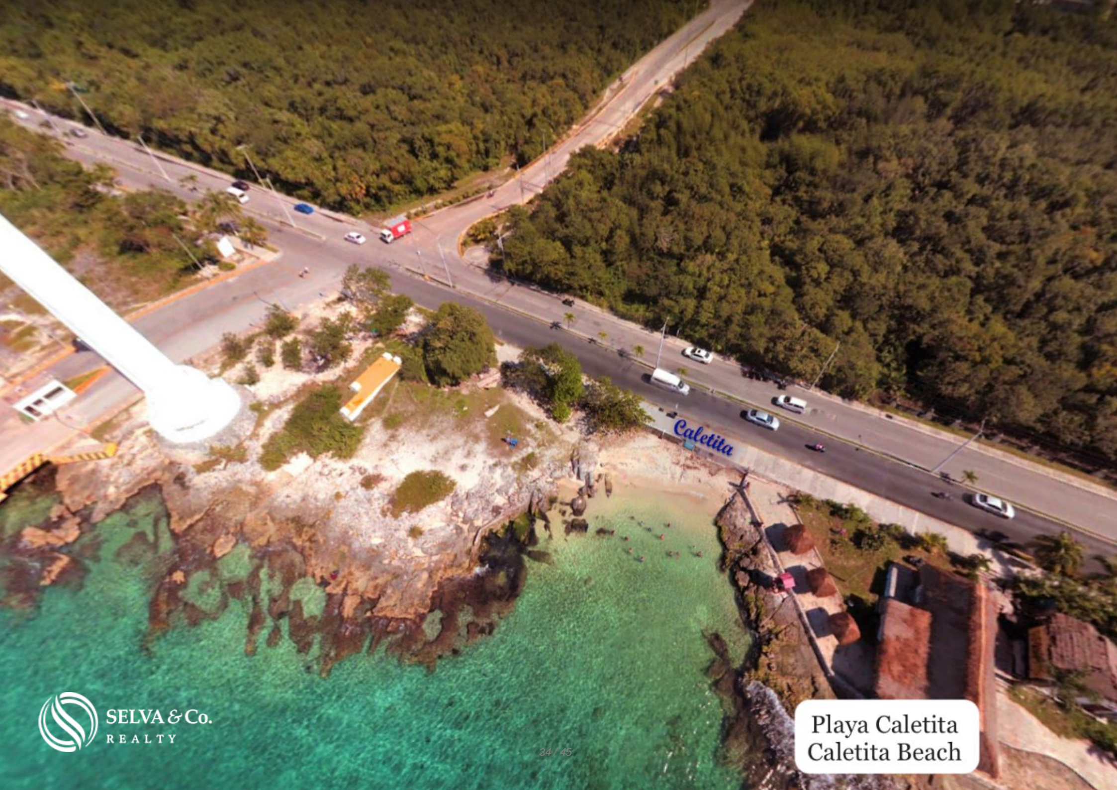
Playa Caletita Caletita Beach