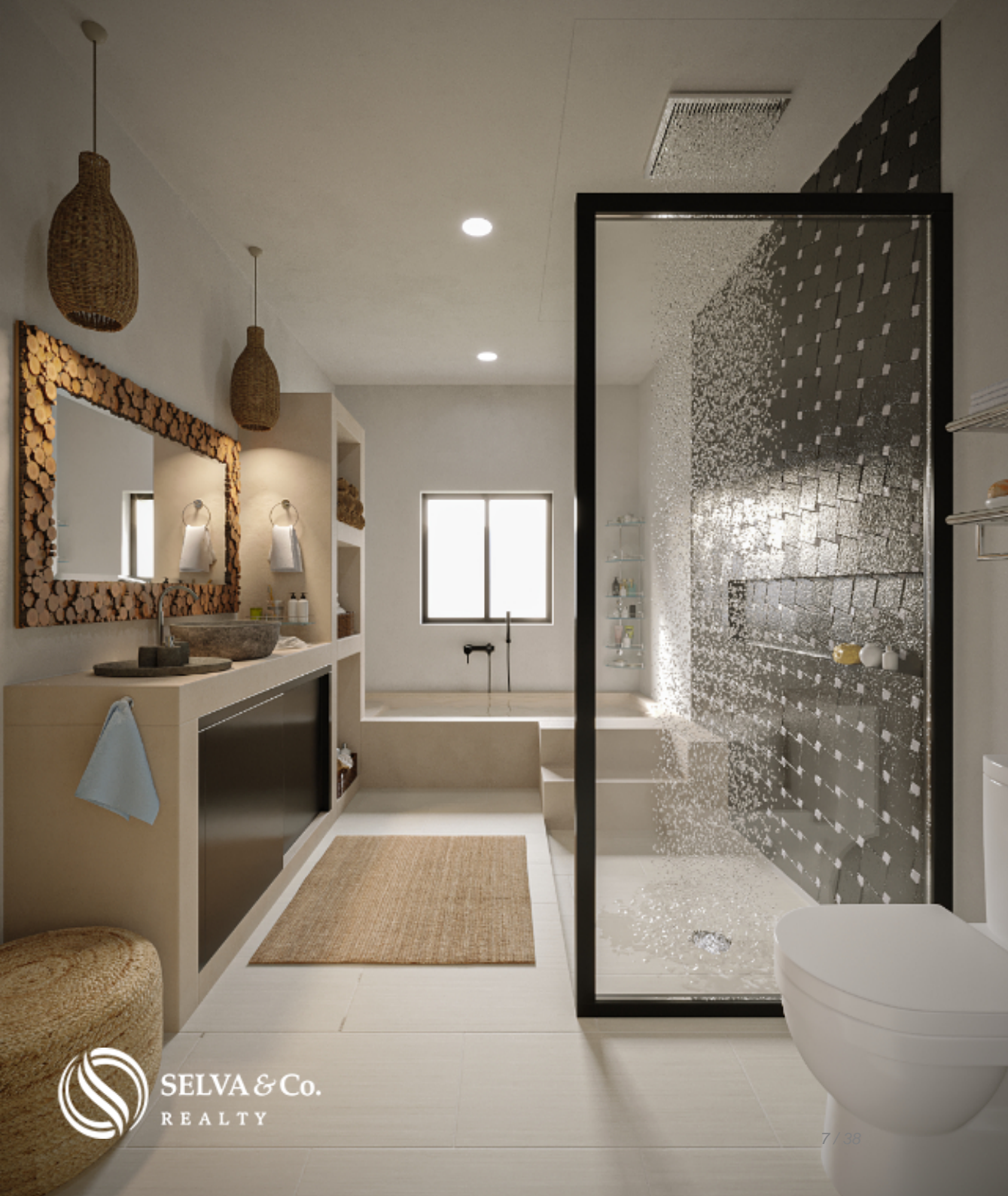
Baño con tina Bathroom with tub