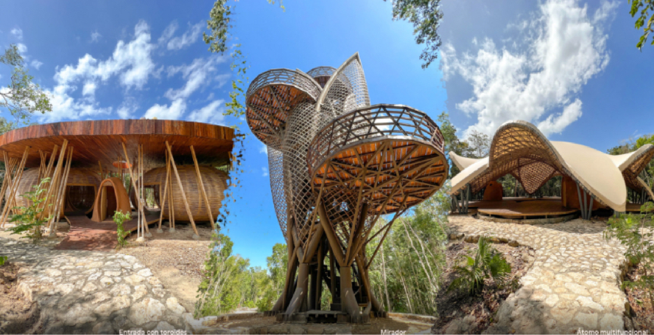
Entrada con torresidas