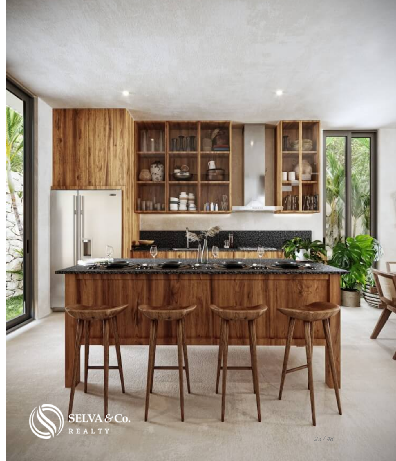
Cocina con barra desayunadora Kitchen with breakfast bar