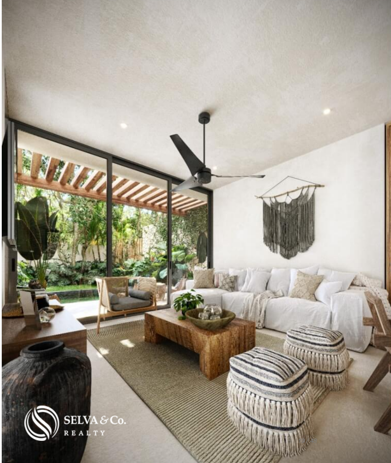
Sala con ventana de pared completa Full wall window in living room