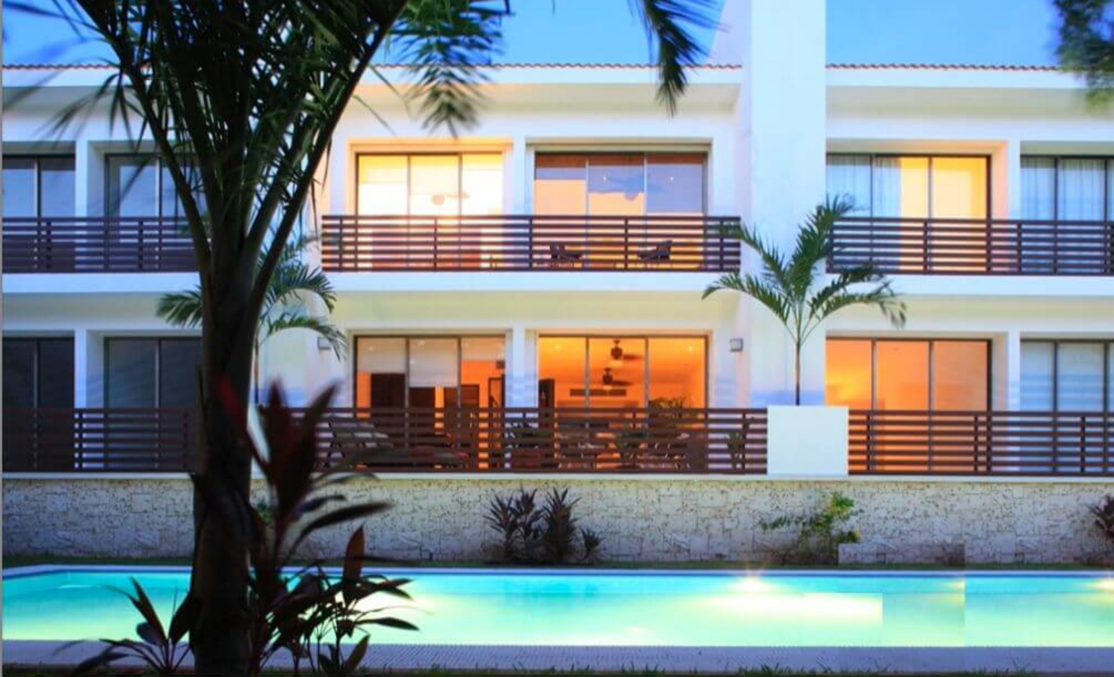
Vista a la alberca - Pool view