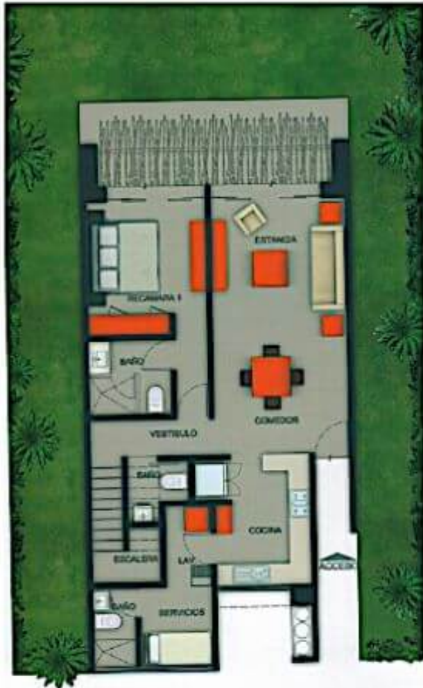
PLANTA BAJA GROUND FLOOR