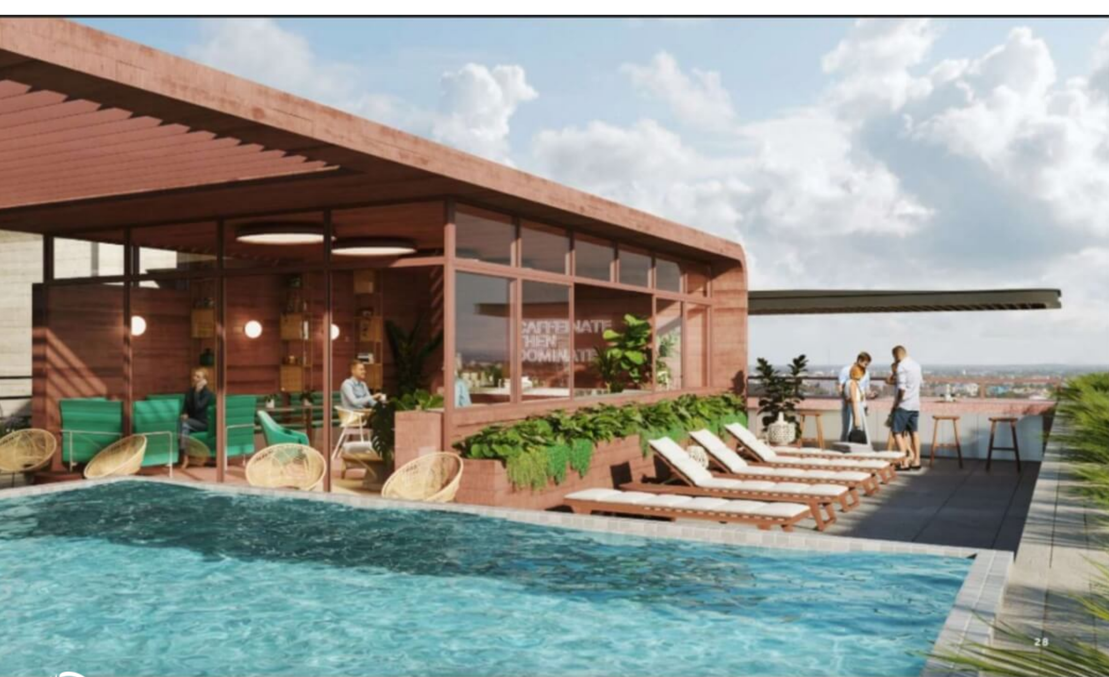
Coworking con zona interior y exterior Indoor - outdoor coworking space