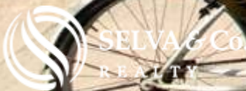
Ciclopista a la playa /Aldea Zama bicycle path