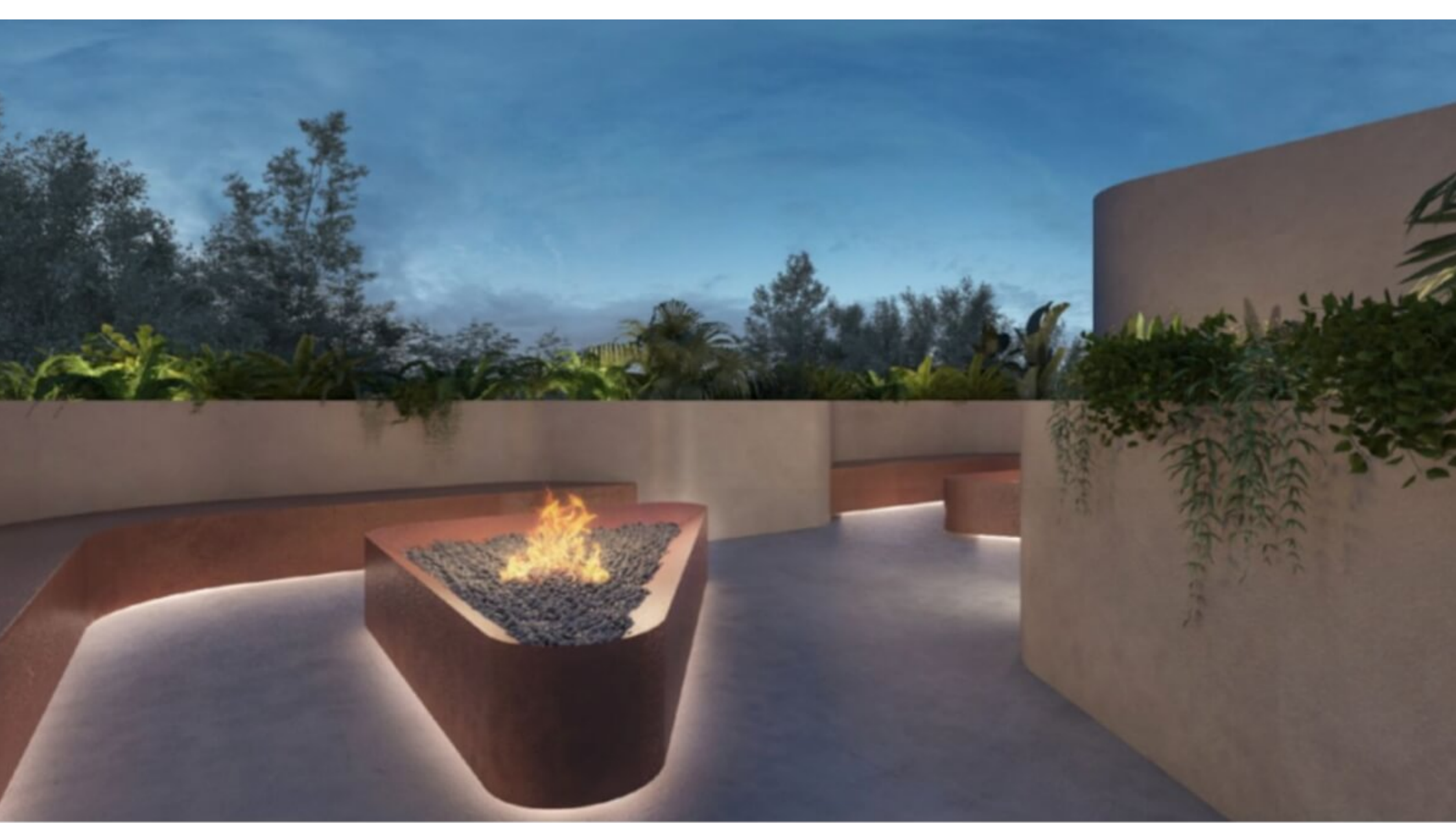
Area de fogata - Fire pit area