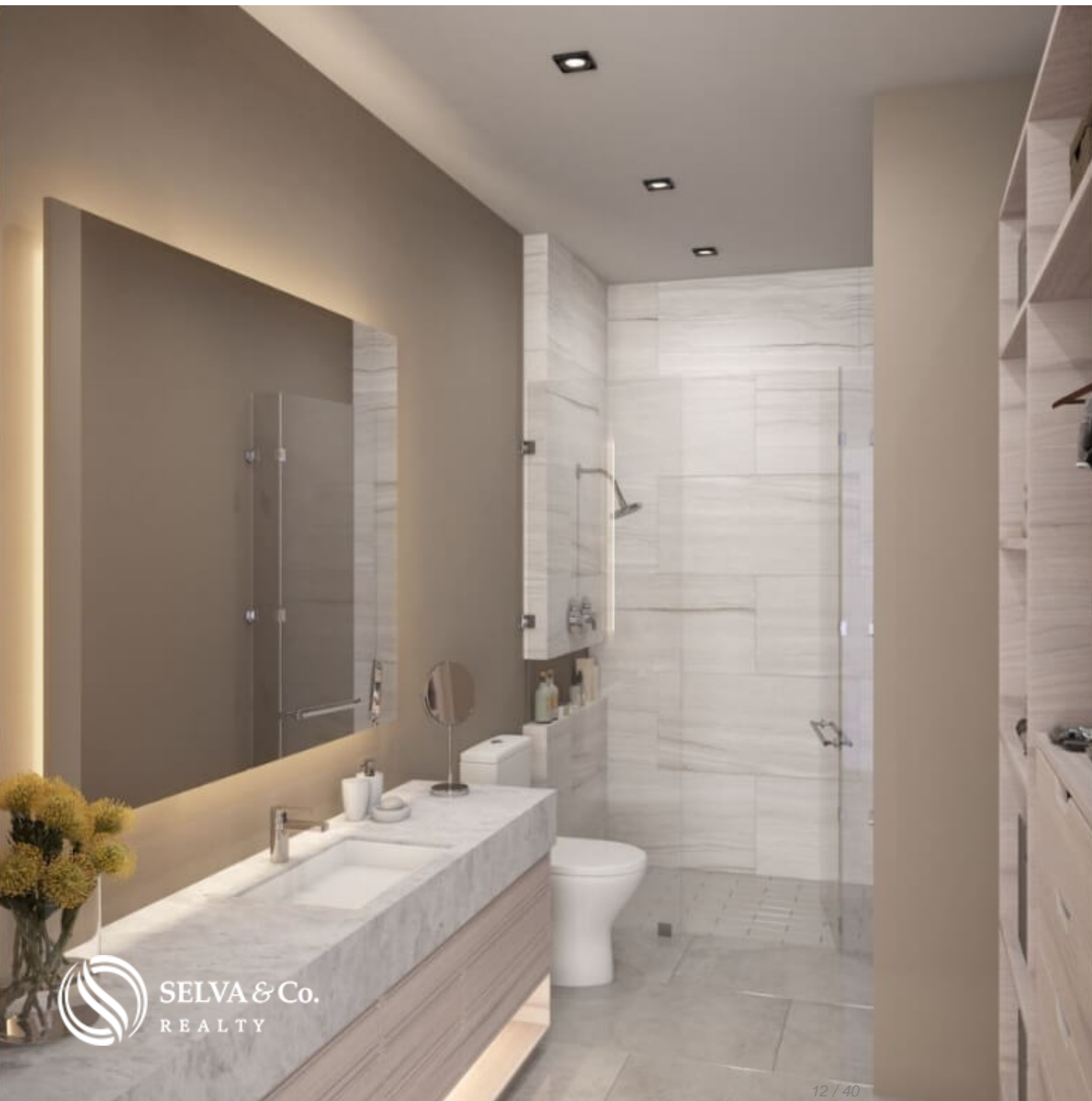
Baño moderno Modern style bathroom