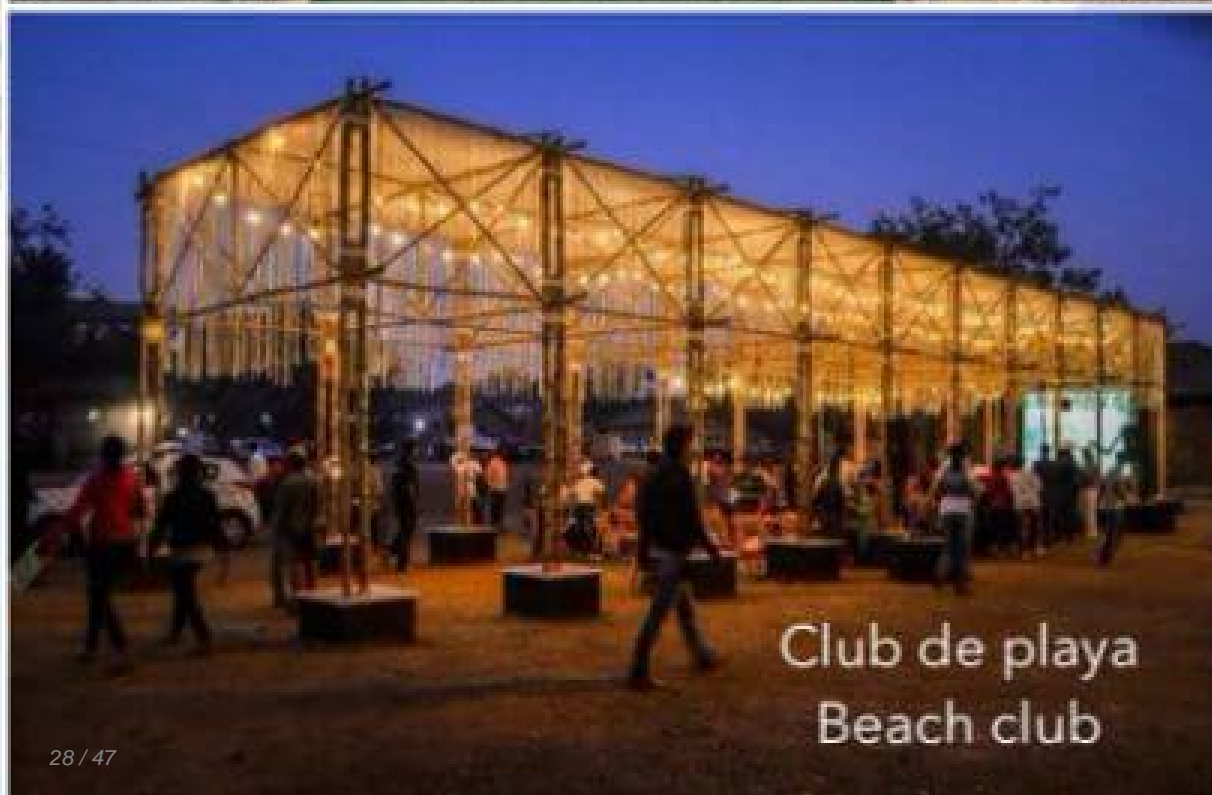
Club de playa Beach club