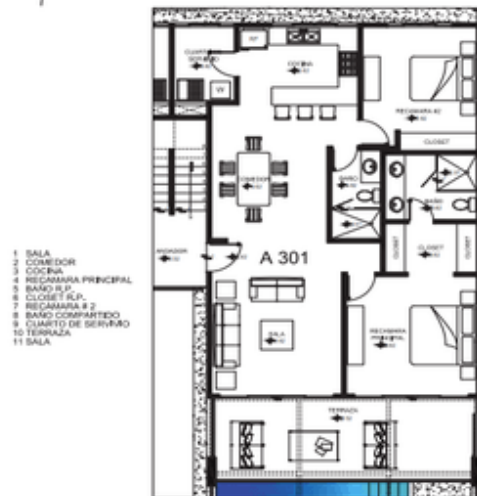
Primer piso First floor